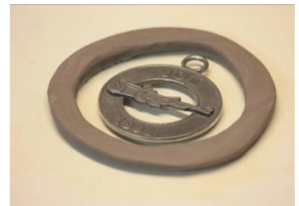
Fig. 2: Een border rondom het model zorgt ervoor dat de siliconen niet weg zullen vloeien.