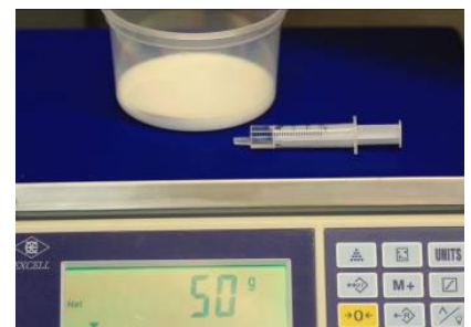
Fig. 3: Omdat de B-component vaak in kleinere hoeveelheid wordt toegevoegd is het handig om gebruik te maken van een doseerspuit. Hierbij kunt u 1 ml. nemen als 1 g.