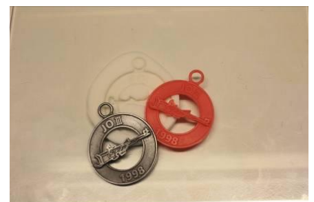
Fig. 5: Het moedermodel, de mal en een in gietwas afgevoerd model (rood)