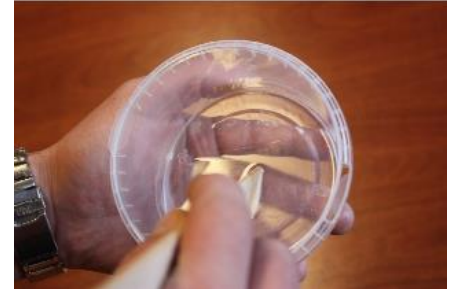
Fig. 4 : Meng de Componenten goed door elkaar zonder lucht in te slaan.