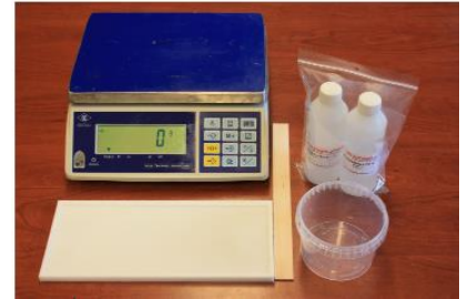
Fig. 1: De materialen worden klaargezet zodat snel gewerkt kan worden.