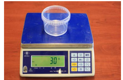
Fig. 2 : Mengbak, 30 gram A-component