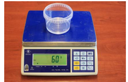
Fig. 3 : Mengbak, 30 gram A component met 30 gram B component (1 : 1).