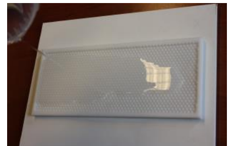
Fig. 5: Giet met een dunne straal en laat de PU vooruit lopen.