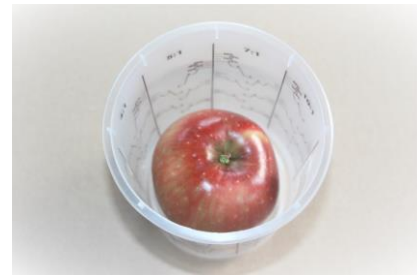
Fig. 3 Het origineel, vastgezet en afgedicht met plasticine.