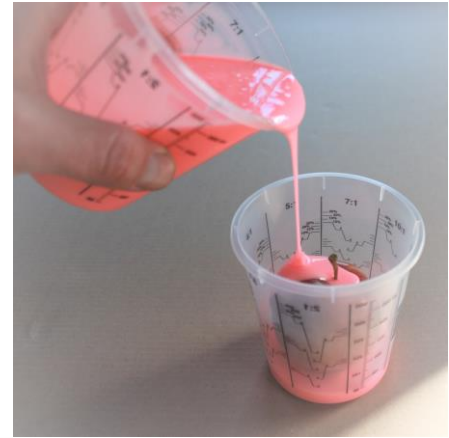
Fig. 4 Giet de siliconen met een dunne straal en vanuit één punt.