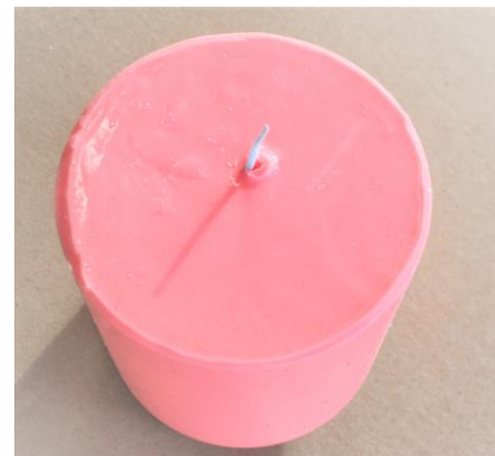
Fig. 6 Het lont is door het gat gestoken en de mal is klaar om af te gieten.