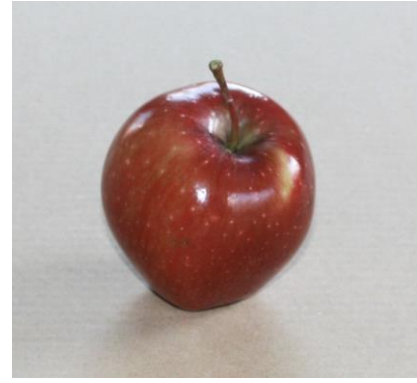
Fig. 1 Het origineel, een appel uit eigen tuin.

Neem een kleine hoeveelheid plasticine klei en draai hiervan een bolletje. Druk dit plat zodat er een soort van mini pannenkoek ontstaat. Leg deze “mini pannenkoek” in het midden van een mengbeker ( Fig. 2 ). Druk nu de appel stevig op deze plasticine zodat er later geen siliconen onder kunnen lopen en het model goed vast zit op de bodem ( Fig. 3 ). Leg de ondergrond waterpas.