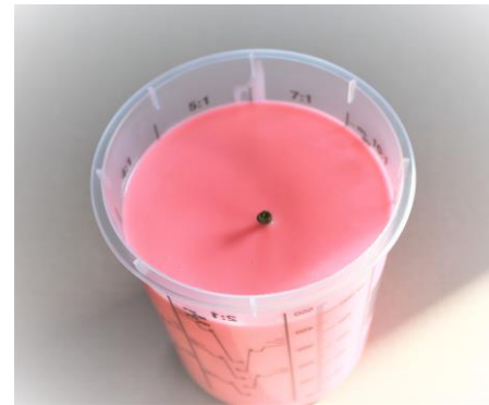
Fig. 5 De appel is niet meer zichtbaar en het stokje steekt nog uit.