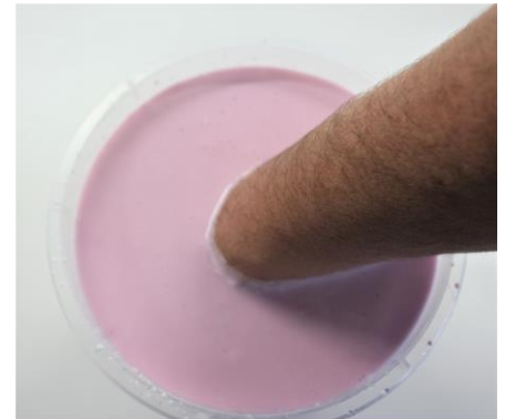
Fig. 5: De hand wordt, in de juiste positie, voor ongeveer 2 minuten stil gehouden.