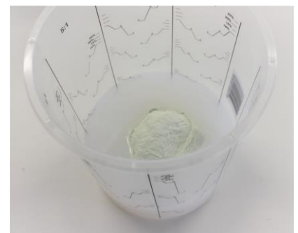
Fig. 2: 55 gram Glow filler aan de a component toegevoegd.