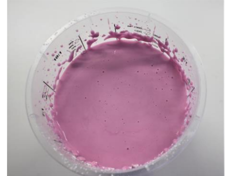
Fig. 4: 1400 ml water gemengd met 350 gram alginaat.

De "Glow Filler" wordt geactiveerd door deze in het (zon)licht te plaatsen gedurende een aantal minuten.