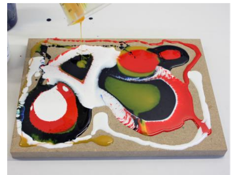
Fig. 5: De epoxy wordt op een creatieve manier over het oppervlak verdeeld (in dit voorbeeld een MDF plaat).