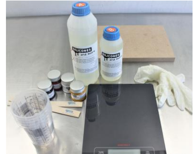
Fig. 1: De set wordt klaargezet zodat snel gewerkt kan worden.

Zorg dat de Epoxy, op het moment van verwerken, rond de 20°C (kamertemperatuur) is.