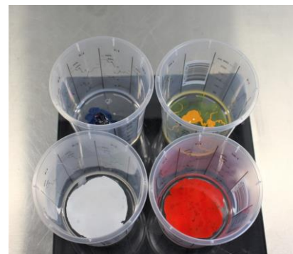
Fig. 3: Vier mengbakjes met elk 20 gram A-component en 10 gram B-component. Daaraan toegevoegd een zeer kleine hoeveelheid kleurstof.