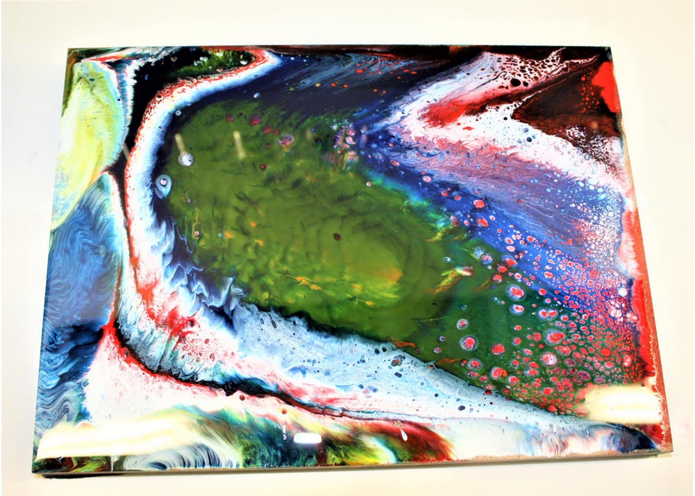
Fig. 6. Eindresultaat.