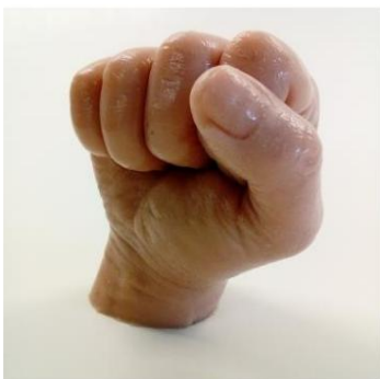
Abb. 6: Beispiel-Endergebnis.

Aus dieser Beschreibung können keine Rechte abgeleitet werden.