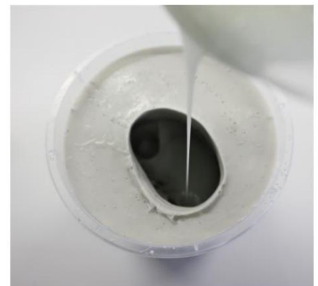
Abb. 5: Das Silikon wird mit einem dünnen Strahl in die Form gegossen.