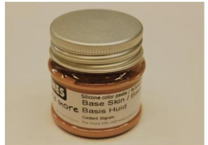
Abb. 2. Wir fügen der A-Komponente 0,5 % Farbstoff hinzu. (0,5 % von 500 Gramm sind 2,5 Gramm)