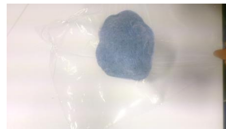
Fig. 16. De schijf epoxy wordt met het onderste folie opgetild.