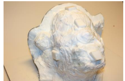
Fig. 10. Op een aantal logische plaatsen zijn siliconen sleutels aangebracht.