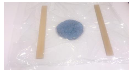
Fig. 13. De massa is goed gekneed en tussen twee lagen folie geplaatst. Links en rechts een latje van 3 mm dik.