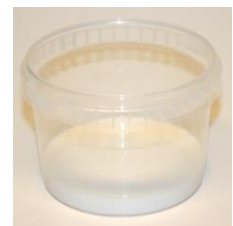
Fig. 7. Een restje siliconen wordt in een bakje gegoten om later sleutels uit te snijden.