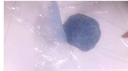
Fig. 15. Het bovenste folie wordt verwijderd.