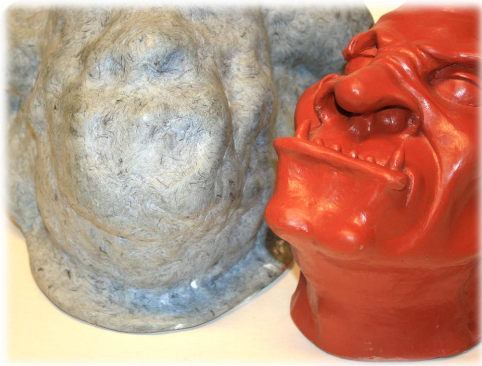
Fig. 22. De mal met daarnaast een kopie, gegoten van rotatie-PU.