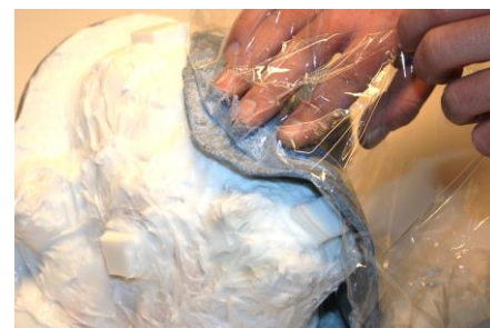
Fig. 17. De eerste schijf epoxy wordt op de siliconen gelegd en goed aangedrukt.