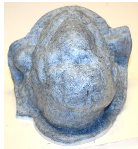
Fig. 19. Het gehele model is voorzien van een 3-4 mm dikke epoxy laag.