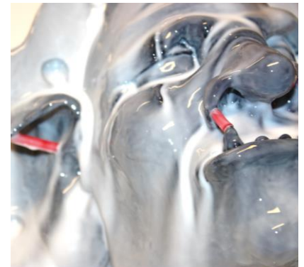
Fig. 6. Het complete model (inclusief de plasticine rand) is voorzien van een, uiterst dunne, eerste laag siliconen.