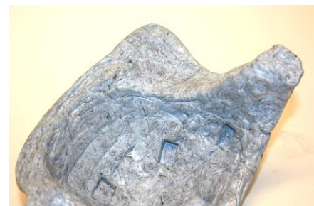
Fig. 20. De binnenkant van de steunkap. De siliconen- sleutels zijn duidelijk zichtbaar.