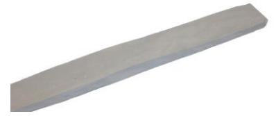
Fig. 2. Een reep plasticine uitgerold tot 4 cm breed en 1 cm dik.