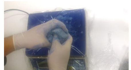
Fig. 12. 100 gram A component (vezel) met 20 gram B component (vloeistof).