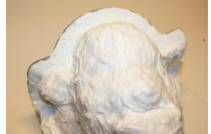
Fig. 8. Het complete model is voorzien van +/- 4 mm dikke laag siliconen. Diepe holtes zijn helemaal dicht gestreken.

De eerste helft van de siliconenmal is na +/- 8 uur voldoende uitgehard en klaar om voorzien te worden van de eerste helft "epoxy steunkap".