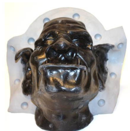
Fig. 4. De rand van plasticine is voorzien van "sleutels".