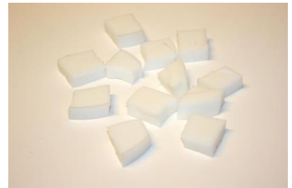
Fig. 9. Blokjes (sleutels) gesneden uit een cm dikke lap siliconen.