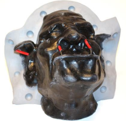
Fig. 5. Beide snijtanden worden voorzien van ontluicht-kanalen. Vanuit het puntje van het rechter oor loopt een kanaal dat niet alleen als ontluchting fungeert maar tevens ter versteviging tijdens het ontmallen.

TIP: Denk aan de potlfe van de siliconen, er is een beperkte verwerkingstijd.