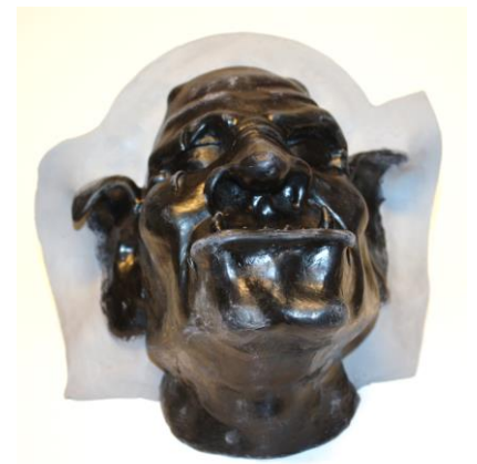
Fig. 3. De plasticinerand aangebracht op de plaats waar later de scheiding (naad) van de mal komt.