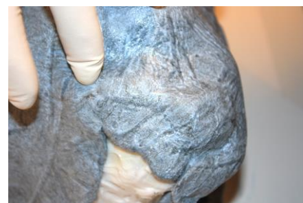
Fig. 18. De naden overlappen een centimeter en worden goed aan elkaar gekneed.