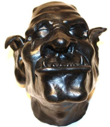
Fig. 1. Trollenhoofd met de afmetingen van een mensenhoofd.

Voordat u de vorm gaat instrijken is het belangrijk dat uw model goed schoon is. Verwijder eventueel vuil, stof en ongewenste oneffenheden van uw mal, uw mal neemt immers elk kleinste detail van uw model over. De glanzende delen in uw model zullen in de mal ook glanzend terugkeren, de doffe delen zullen in de mal dof blijven. Behandel nu het model (indien noodzakelijk) met een lossingsmiddel. Bedenk dat sommige lossingsmiddelen uw originele model kunnen veranderen (vetvlekken etc.) en zelfs het oppervlak kunnen veranderen. Zo kan een dof bedoeld oppervlak gaan glimmen en dus ook in de mal glimmend terug komen. (Fig. 1.)