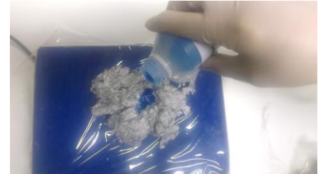
Fig. 11. 100 gram A component (pasta/vezel) met 20 gram B component (vloeistof).