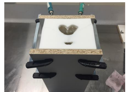
Fig. 11: De mal tussen twee plankjes voorzien van een aantal klemmen.