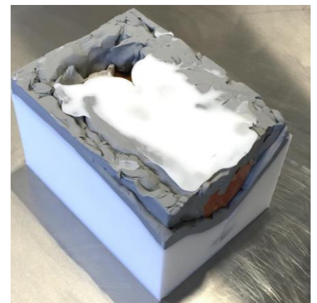
Fig. 6: Het model wordt inclusief plasticine en siliconen omgedraaid.