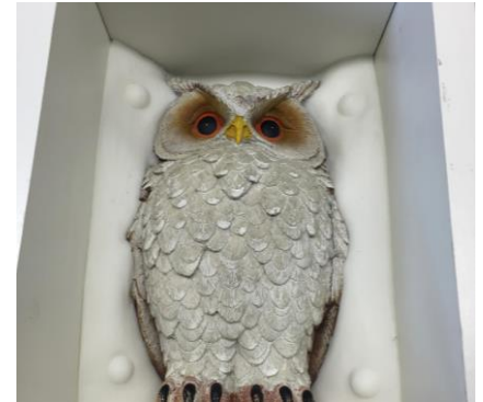
Fig. 8: Rondom de gevormde deelmal wordt wederom een omkisting geplaatst. De omkisting wordt zorgvuldig afgedicht.