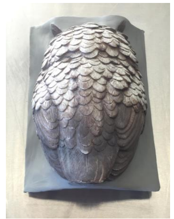
Fig. 2: Het model, gepositioneerd en ingebed. Met het inbedden wordt de deelnaad bepaald. Dit model benodigd geen ontluchting.