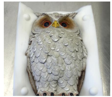
Fig. 7: de plasticine is verwijderd en de siliconen zijn bijgesneden. De eerste laag siliconen is voorzien van een losmiddel.