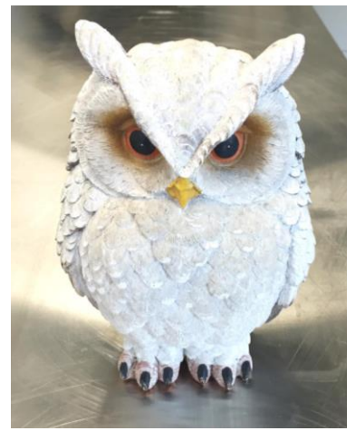
Fig. 1: Een plastic moedermodel. Nieuw, dus een losmiddel is in dit geval niet nodig.