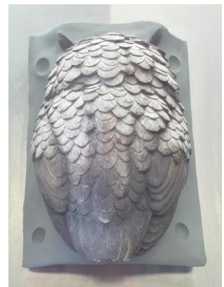
Fig. 3: Rondom de vorm (in de hoeken) zijn een aantal sleutels aangebracht.