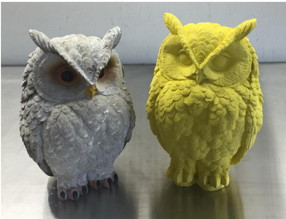
Fig. 13: Het moedermodel en het kopie.