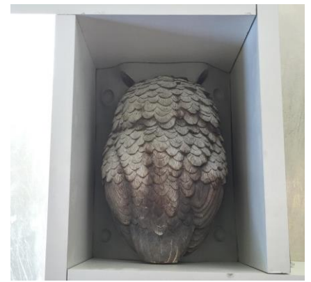
Fig. 4: Een ingebed model met aangebrachte omkisting. Gereed om gegoten te worden.